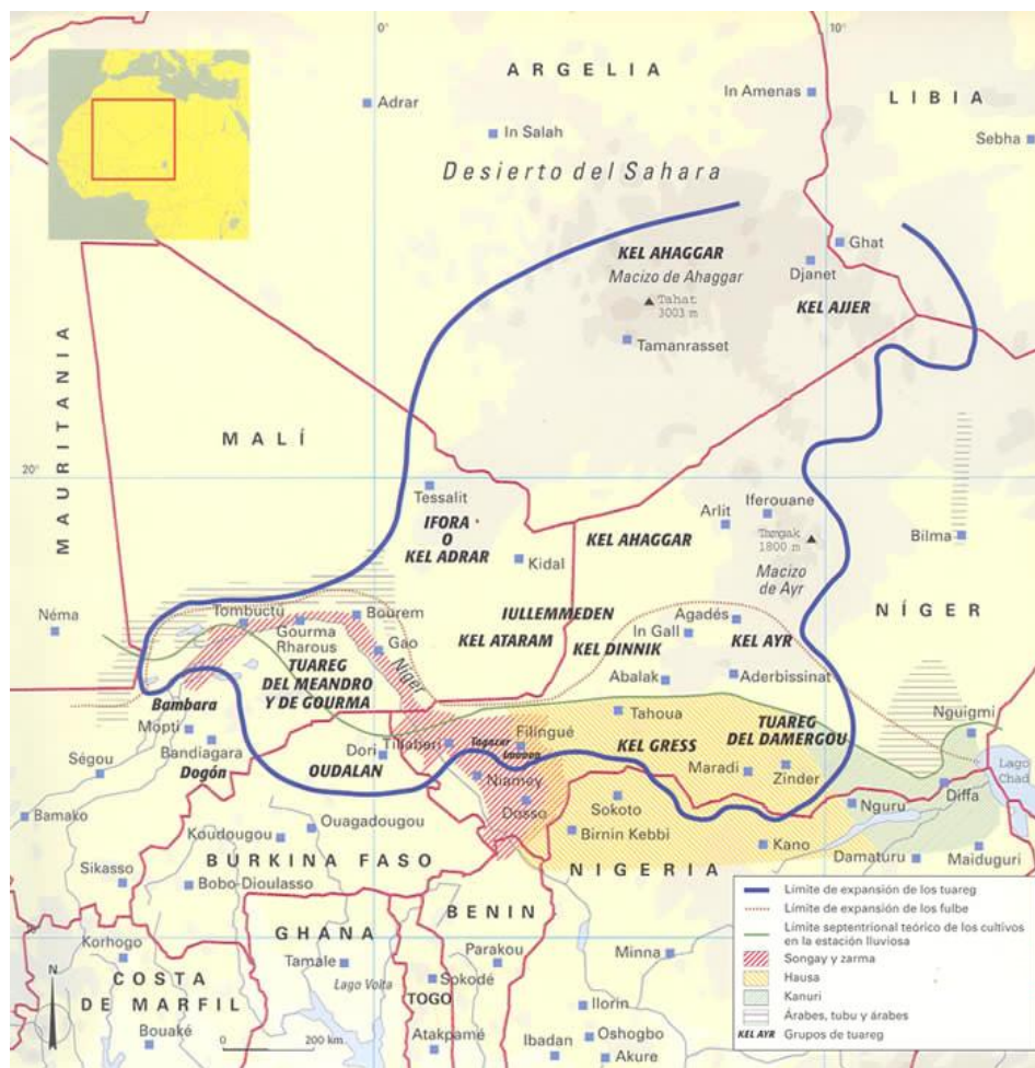
Lugares en los que habitan los Tuareg