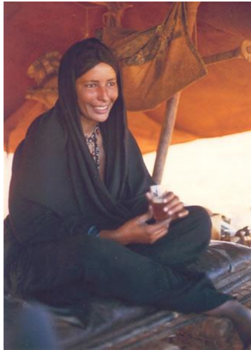
Mujer Tuareg en tienda de campaña

Gumía: Arma blanca, con aspecto de daga encorvada, usada por los moros.